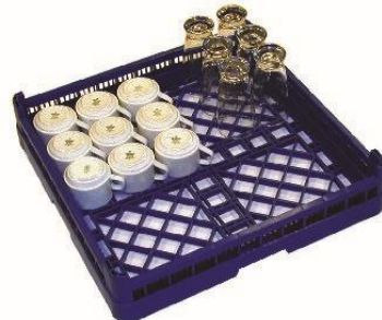
PANIER À OBJETS CREUX 50x50cm