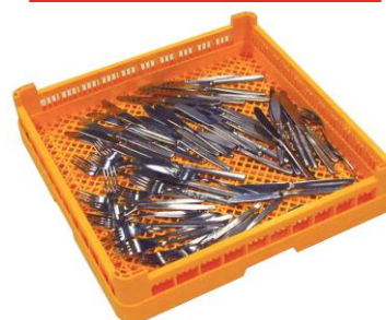
PANIER POUR PETITES PIÈCES 50x50cm