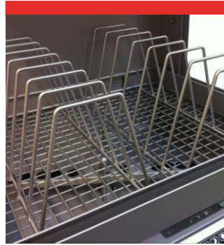
RACK Pour 7 plaques