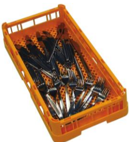
PANIER POUR PETITES PIÈCES 25x50cm