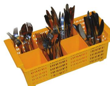
PANIER À COUVERTS Par 8 cases