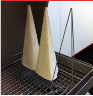
SUPPORT DE POCHE À DOUILLE Pour 3 poches