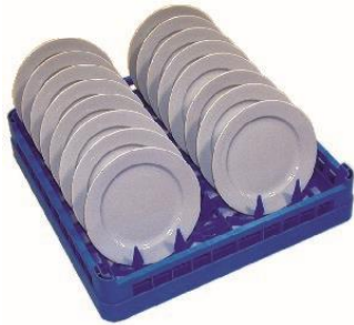
PANIER | 16-18 pc 50x50cm