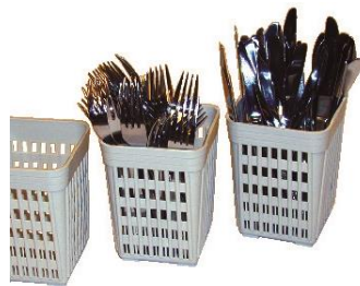
PANIER À COUVERTS Cases Individuelles